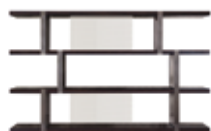
10 DALTON BIBLIOTHÈQUE CM 360X40 H148