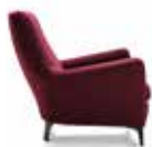
5 DENNY FAUTEUIL CM 88X95 H88