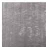
11 DIBBETS TAPIS CM 500X400